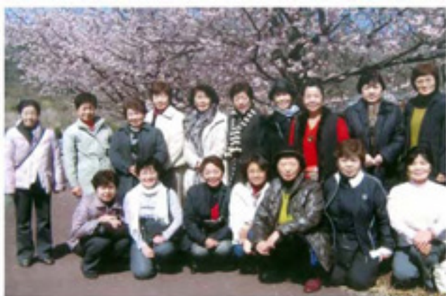
3月5日役員研修旅行:伊豆大寒桜にて

うっとうしい季節になりましたが、皆様には御健勝にお過ごしのこととお慶び申し上げます。婦人部では3月5日(木)に役員研修及び、地域の皆様との交流、親睦を深めるため、日帰りバス旅行を行い、多くの方のご参加をいただきました。