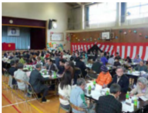
第21回定期総会に参加した組長さん

第三点は、下校時の学童防犯パトロール、夜間等の防犯諸活動の充実にあります。当町内会は非常に大きく学区も五つに分散し、各地区ごとに分かれて実施してまいりました。昨年“災害ゼロ”でした。