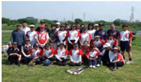
選手・役員の皆さん