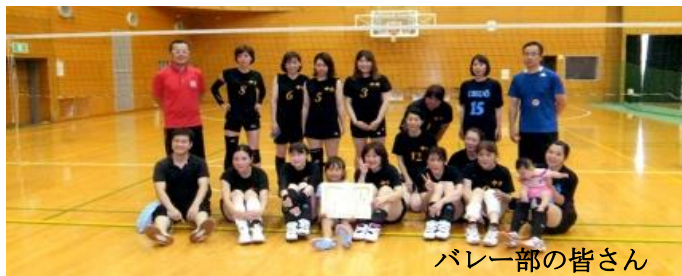
バレー部の皆さん

これからも、バレー部は選手みな一丸となり練習、試合を頑張っていきたいと思っておりますので皆さんどうぞ、宜しくお願い致します。